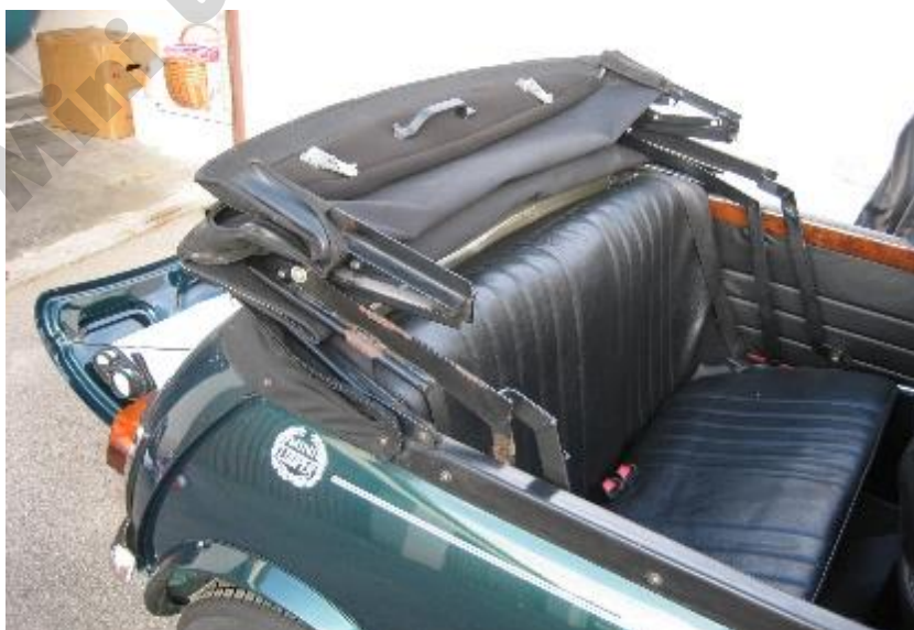
@MMCK Archiv_P.Stellwag_R&R Cabriolet_Vergaser Cooper_EZ 1991

Qualität im Detail war bei R&R nicht nur so dahingesagt. Unvergessen der Auftritt mit einem der frühen Cabriolets beim Internationalen Mini Meeting IMM 1988 in Solingen, wo einer der Roberts wie besessen an einem Verdeckabschluß und der Lage der Verdeckdichtung vorne rechts am Tür-Dreiecksfenster bzw. Scheibenrahmen herumtüftelte, „damit das endlich perfekt sitzt“!