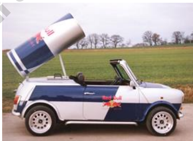
Red Bull Mini von R&R

Da R&R nahezu jeden Sonderwunsch bei Umbauten erfüllt, ließ die Getränkefirma Red Bull 1996 insgesamt 90 Promotion-Fahrzeuge auf Basis des Mini-Cabriolets bei R&R bauen.